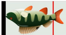
UPSIDE DOWN, NOT OK!