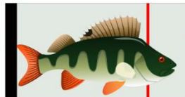
HEAD TO THE WRONG SIDE, NOT OK